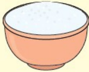
น้ำตาลทราย

ต้นกล้าทำน้ำเชื่อม โดยใช้น้ำตาลทราย 2 ถ้วย ผสมกับ น้ำ 1 ถ้วย